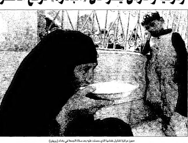
عمور عرابية تتناول مباحثها التي حصلت عليه بعد صلاة الجمعة في بغداد

واشنطن ولندن أجمعتا على ضرورة استمرار الحظر على العراق، وهو ما يتناقض مع موقف بعض الدول التي تطالب برفع الحظر عن العراق. وقال ان استخدام لبنان كميكان معركة بديل في سوريا هو خيار غير مقبول. وقال ان استخدام لبنان كميكان معركة بديل في سوريا هو خيار غير مقبول.